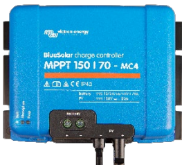
Solar-Laderegler MPPT 150/70-MC4