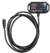
VE.Direct Bluetooth Smart Dongle