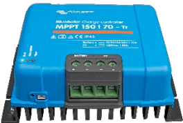
Solar-Laderegler MPPT 150/70-Tr